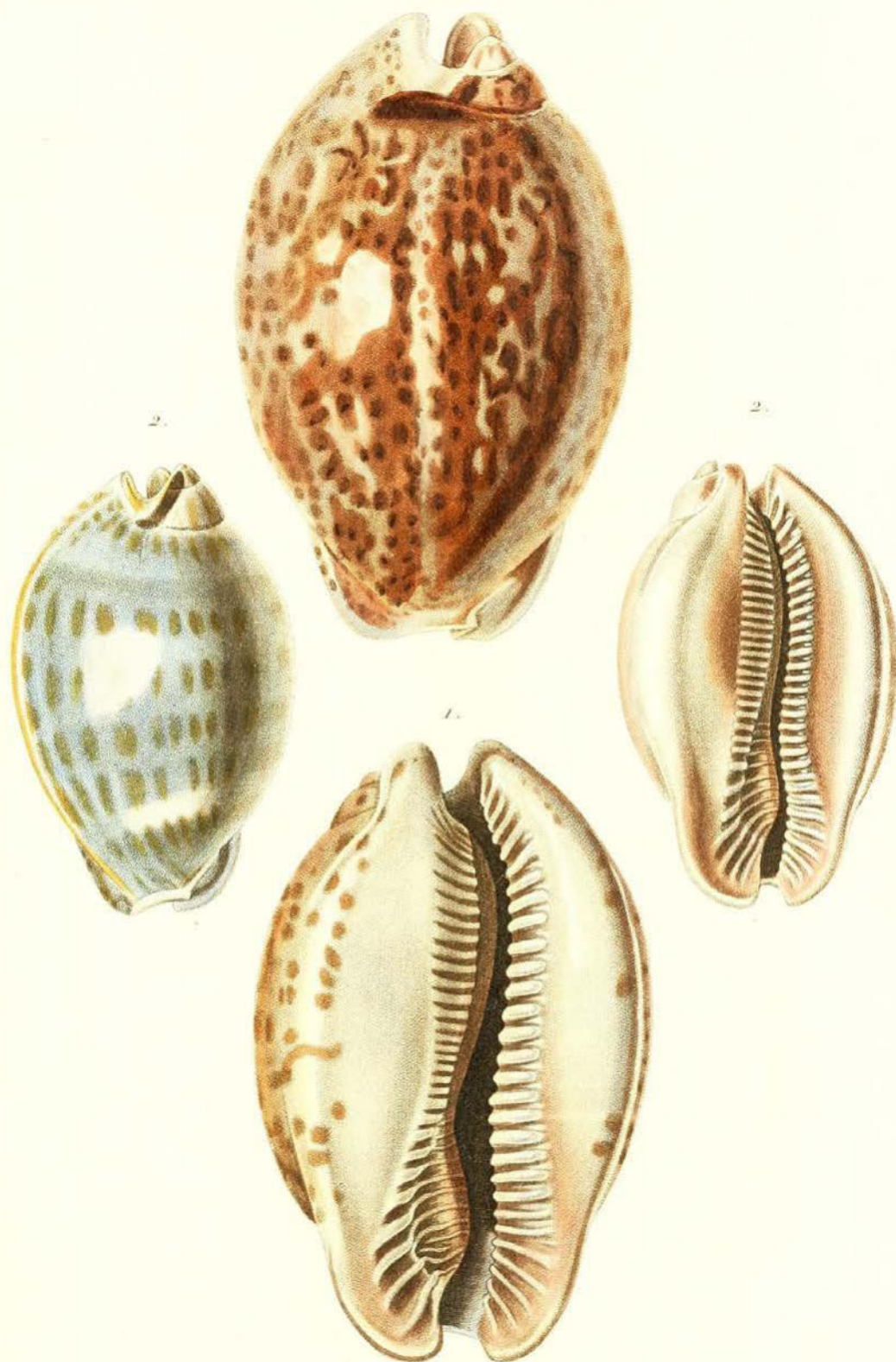
1. Porcelaine rat. 2. Porcelaine id: jeune.

( Cypraea rattus , Linn.) ( Cypraea id: junior )