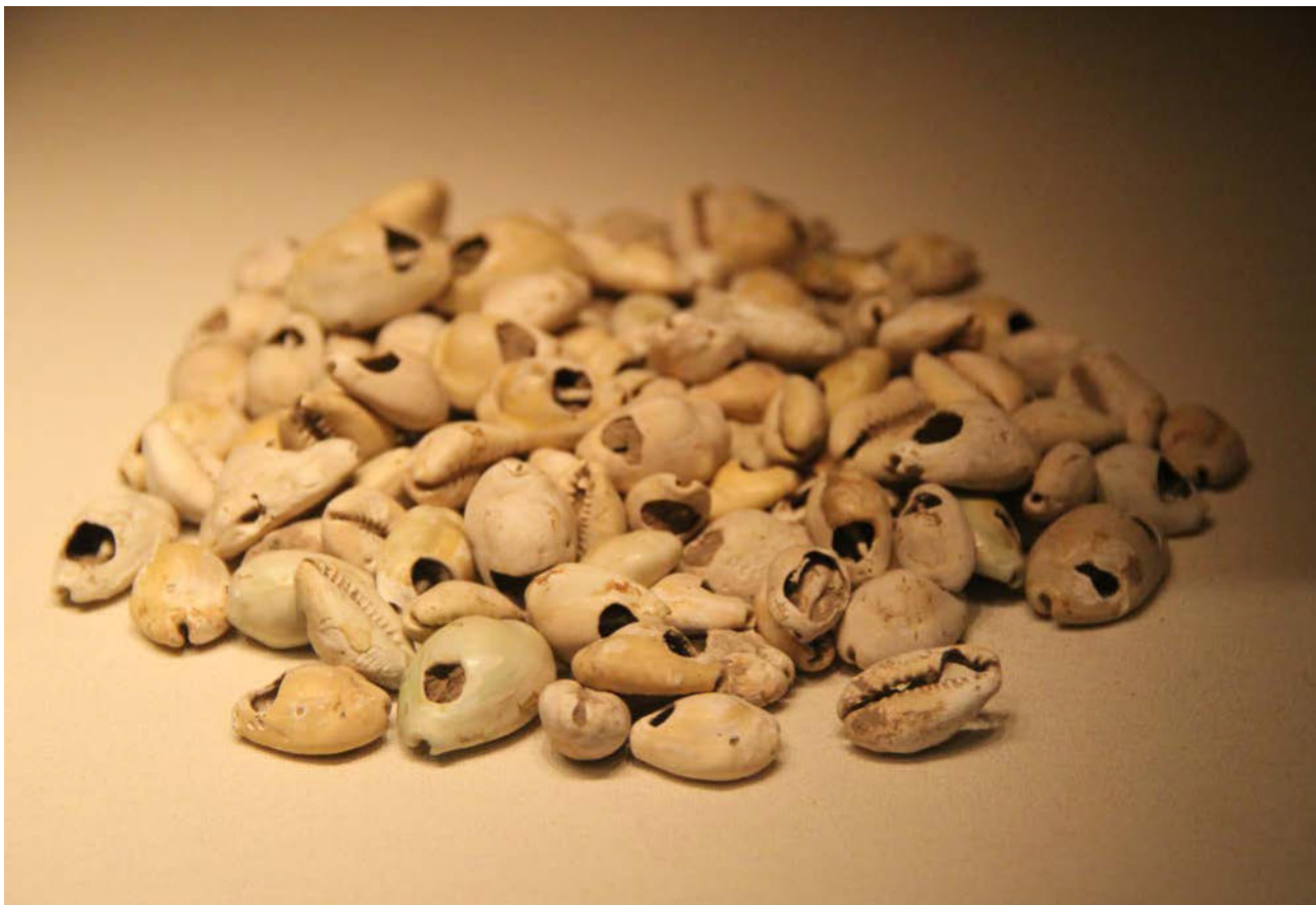
圖 1. 1976 年河南安陽殷墟婦好墓出土的海貝，中國國家博物館藏。（圖片來源：Gary Todd, Public Domain via Flickr <flic.kr/p/fYDnvg>。）

題，包括運送海貝的船隻形制，當中有許多阿拉伯船隻，這些船不用鐵釘連接，而是用椰索縫合。他也在另外一篇文章中提到“阿拉伯船隻建造的特點，即用椰索捆綁船板，船體不用鐵釘和油灰”，並再作補充論述。 16 這種廣視角、多要素的觀察無疑對聯結各種現象的能力提出挑戰，但同時也容易迸發出問題的參差。