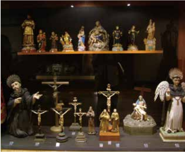
圖 3. 玫瑰堂聖物寶庫內景

（四）私人的展示空間：目前澳門大約有十餘家專業書畫店，如空間寬敞、會定期舉辦青年人個人展覽的三巴藝門（St. Paul's Fine Art），葡文書局的二樓也能展示書畫作品。雖然在澳門的部分旅遊景點也會有一些美術與工藝商店、畫廊，但是一般規模都不大，只能展示一至兩人的小型作品，來展者較多是葡語國家或地區的普通畫家。另外，短期的私人展覽場地隨時會出現變換。