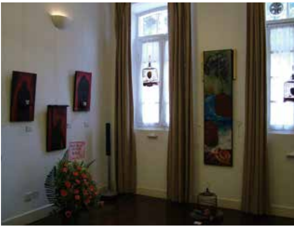
圖 9. 澳門葡人之家協會展廳內景

雕塑置於展館及校園開放區域，讓它們體現學校的歷史、特種專業或優勢特色；體現學生的人文主義理想，充分自由、民主、開放的時代精神；體現學校藝術類專業師生創作作品的優秀水準。