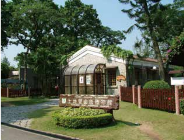
圖 5. 土地暨自然博物館

的“澳門藝術博物館之友”，就讓公眾有更多機會接觸及參與博物館所舉辦的各類展覽與活動。該館還設立團體免費導賞預約，為參觀者、尤其是中小學生提供講解服務。它作為澳門重要的文化機構，以及城市文化設施的重要組成部分，很好地承擔了其社會教育責任。而公眾教育功能的達成，又必須以受眾的普遍性為基礎，這與上述的參與性、趣味性一起構成了博物館教育的兩個要素。