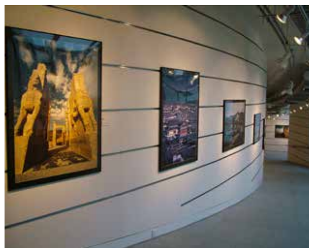
圖 7. 大炮台迴廊內景

澳門藝術博物館還定期與其他國家或地區合作舉辦各類型的交流展覽，從 1999 年底至 2018 年已舉辦超過一百三十餘場。同時舉辦的特展與臨時展覽也有五場以上。在澳門地區，平均每一週就有兩次或以上重要展覽開幕，平均每天會有兩個以上的普通畫展開展。這些展覽涉及範圍很廣，其中包括達世界級水準的“海國波瀾——清代宮廷西洋傳教士畫師繪畫流派精品展”“文明之光——墨西哥古代文物珍品展”“巨匠心影——畢加索版畫展”等重要展覽。許多展覽的策劃與投入，遠超過了博物館