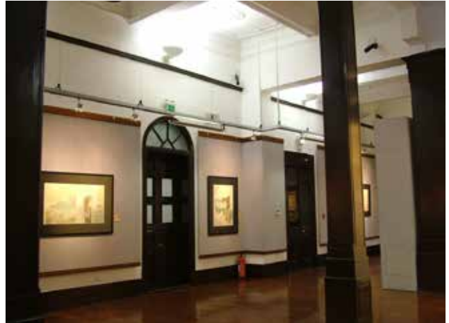
圖 8. 盧廉若花園春草堂展廳外景及內景