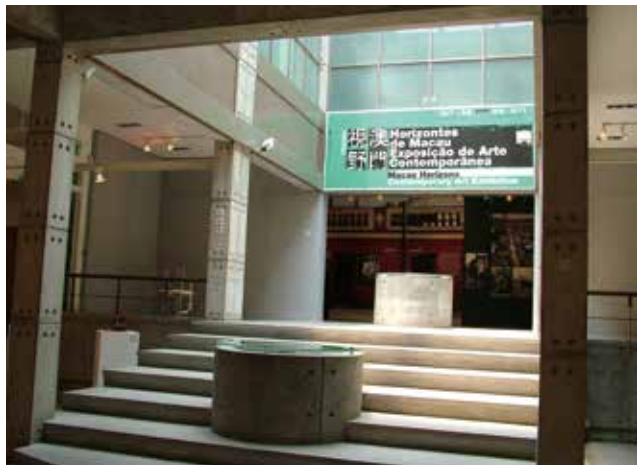
圖 6. 塔石藝文館內景