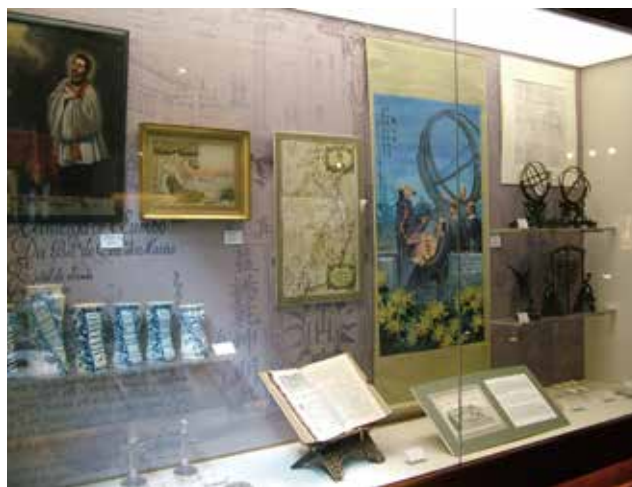
圖 2. 澳門博物館內景

與上述場館相對的是完全為藝術類展示服務的場地，它們多數也由政府提供，但社會團體與私人活動佔重要地位。由於這些場館由舊建築改成為多，缺乏相對固定性，現在只能將有代表性的單位分類介紹如下。