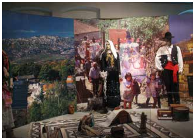
圖 4. 龍環葡韻住宅式博物館外景及內景

高在上的，它既是公眾積極參與活動的地方，又是學習、休閒的場所。在展覽與競賽體制方面，由於大量新建的展覽館、博物館和原有的展覽場地可以利用，各方都進一步推出新展覽與獎勵措施，大大調動了社會藝術活動的積極性。澳門藝術博物館的建立，形成了歷年系統化、專題化的週期性展覽。既有大型本地專業性質的展覽，也有引進世界各地的高層次展覽。在為本地服務方面，其舉辦的展覽則包括：“全澳書畫聯展” 10 “澳門視覺藝術年展”“澳門設計藝術雙年展”“澳門美術協會美術作品展”等。澳門美術協會在 2016 年舉辦六十週年慶典活動，同時有多場主題展覽，包括：在南灣舊法院大樓展覽館的“澳門美術協會會員作品展 2016”、在澳門回歸賀禮陳列館專題展覽廳的“甲子憶懷舊——澳門美術協會前輩作品展”，以及在澳門教科文中心展覽廳的“澳門美術協會成立六十週年作品邀請展”等。同樣地，一些其他群眾團體的展項均會在重要的博物館或視覺藝術展覽場所進行。