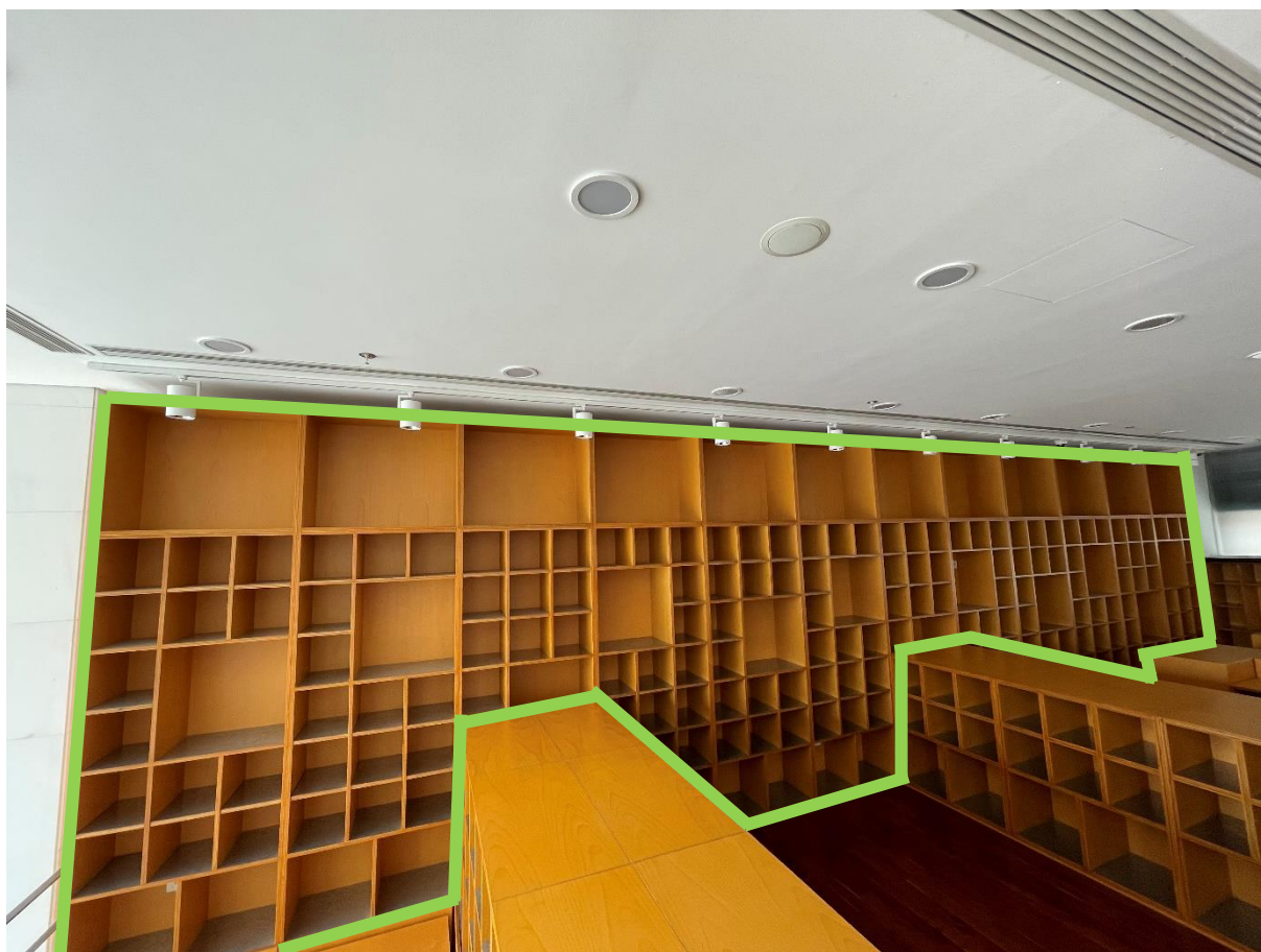
一樓的牆身櫃（綠色框部分）

澳門特別行政區政府 Governo da Região Administrativa Especial de Macau 文化局 Instituto Cultural