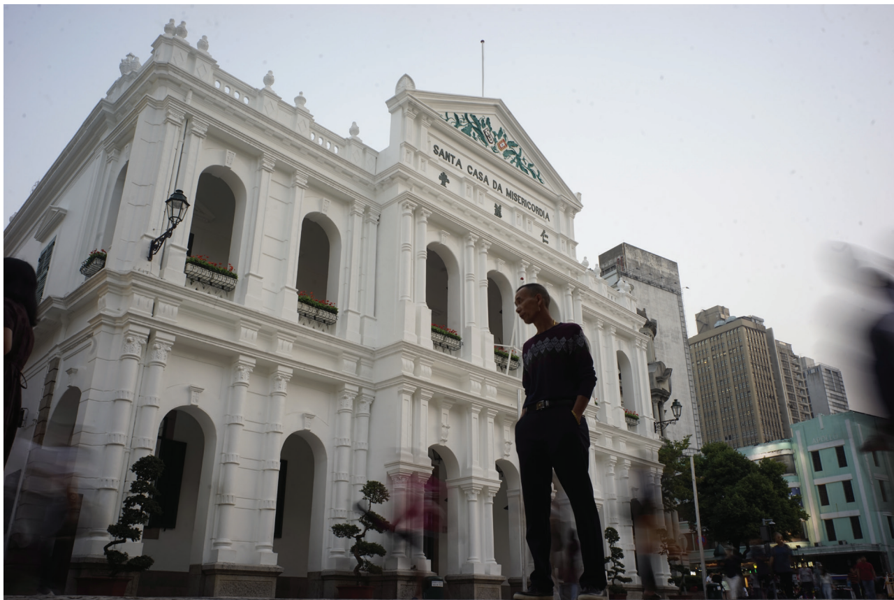
Santa Casa da Misericórdia. Macau, 2019.

de morte, porque então se faria o que melhor parecesse ao Provedor e Irmãos da Mesa, e, neste caso, a caridade Cristã pedia que o tal preso não fosse desamparado. No livramento dos presos, e mais coisas, deviam seguir o regimento, e ordem que lhe desse o Provedor e Mesa, e seriam obrigados a dar nela conta todos os Domingos dos termos em que iam os feitos, e do modo com que se corre com eles estando presente o Solicitador dos presos, e o Advogado, da Casa para com esta notícia se prover no que parecesse necessário. Deviam fazer com que os presos se confessassem, e comungassem pela Quaresma, e pelos quatro jubileus do Bispado, que era dia da N. a S. a de Assunção em Agosto, e dia de Todos os Santos o primeiro de Novembro, dia do Natal, e do Espírito Santo. Deviam prover os presos, fazendo que do Hospital lhe viesse o comer cada dia, salvo se a pessoa fosse de qualidade que conviesse mais dar-lhe o necessário em prata, o que se veria em Mesa