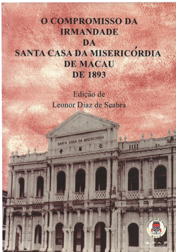
O Compromisso da Misericórdia de Macau de 1893. Macau: Universidade de Macau, 2004.

O Tesoureiro deveria arrecadar as esmolas da Santa Casa, assim como todas as que lhe fossem