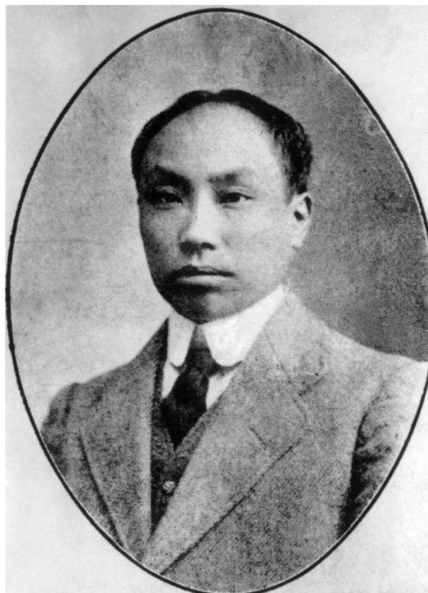
圖4.《新青年》主編陳獨秀

也已。故古來先覺，知宇宙之虛幻，無足冀求，皆不敢大張其言，待人由經歷挫折中覺悟。佛氏言之，而流弊滋大。惟日本學者得其真諦，了悟生死，超脫物欲。武士道之流，盛昌舍生赴義，以捍國家，踵背相接，其故可思矣。夫人瞽於當前之情欲，陷沒難拔，雖父母兄弟流涕而勸，猶不反顧。此蓋勸者之情，不足以剋其愛溺情也。今足下欲導人於道德之域，曰“爾當愛國、爾當愛群、當趨於仁義，更當為社會求幸福。”雖日聒於陷溺者之耳，未見其效愈於父若兄之勸也。故今日欲振污世、起衰溺，惟以陽明先生“致良知”三字為正的。以清宵良夜之言，激撼其習心，促迫其覺悟。然後能領會善言，臻於道域。惟道德第一關頭，在自身先有覺悟之機，而覺悟又非空言所能為力。若無覺悟之機，雖強聒忠言善語，求其效十不見