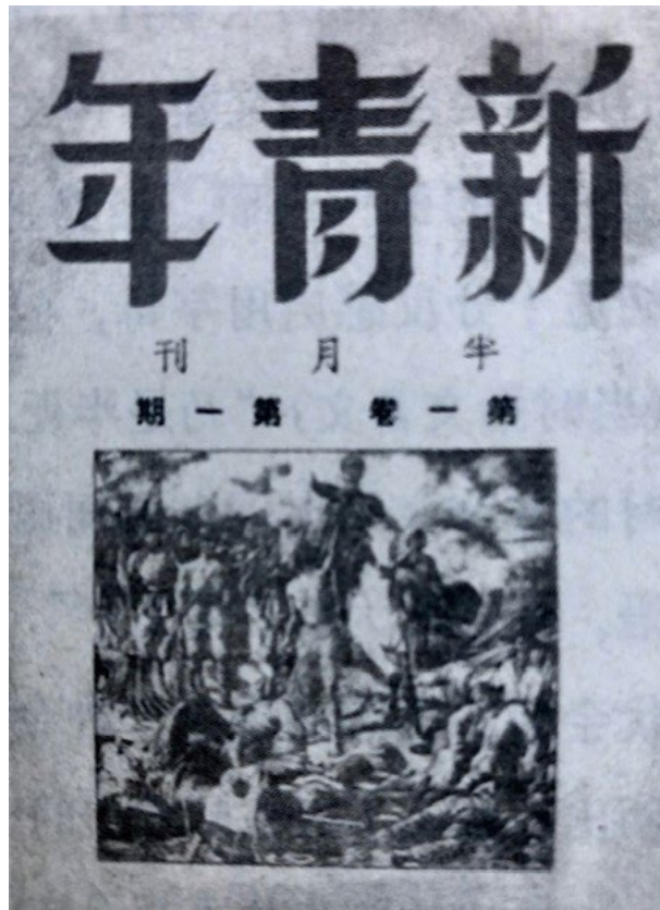
圖 6.《新青年》第一卷第一期創刊號封面

秀創刊主編《青年雜誌》（一年後即第二期起改名《新青年》）為端倪的陣地，待到“五四”運動興盛時，便得到了進一步的發展。其宗旨是：積極宣導民主與科學；反對袁世凱總統的尊孔復古、復辟帝制的倒行逆勢；反對舊道德、提倡新道德；反對文言文、主張白話文；反對舊文學、提倡新文學；由此派生了新文學革命，標示着中國現代文學的燦然登場。