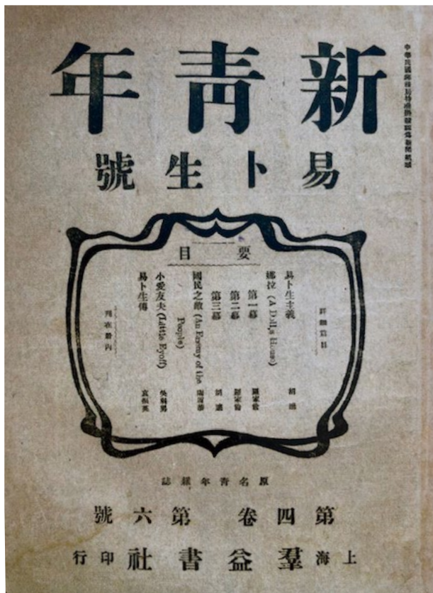
圖3.《新青年》（易卜生號）封面