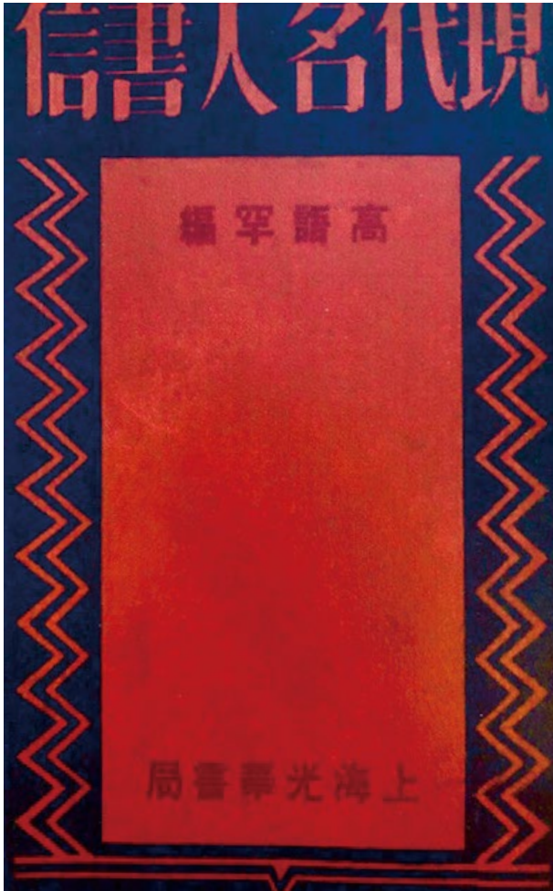
圖 1. 高語罕編《現代名人書信》（1933 年上海光華書局）彩色封面